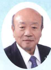
西京区自治連合会 会長 社会福祉法人