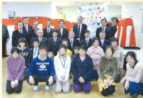
玉名市野菜振興協議会様より野菜贈呈式